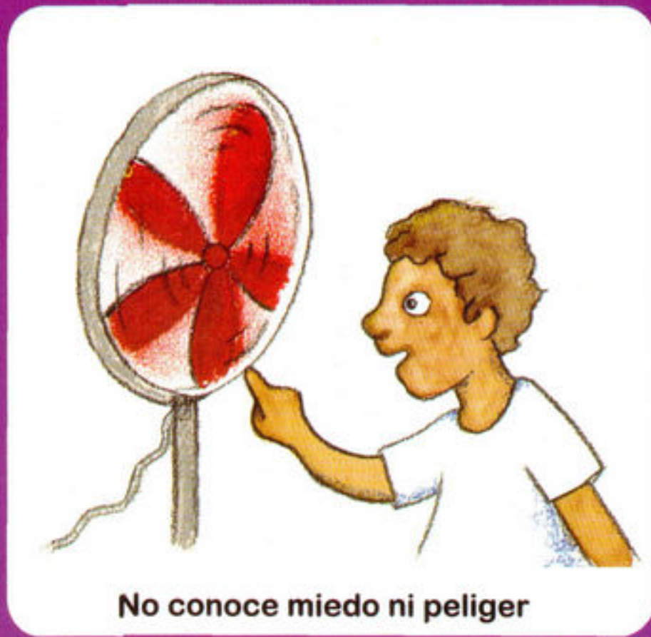
No conoce miedo ni peliger